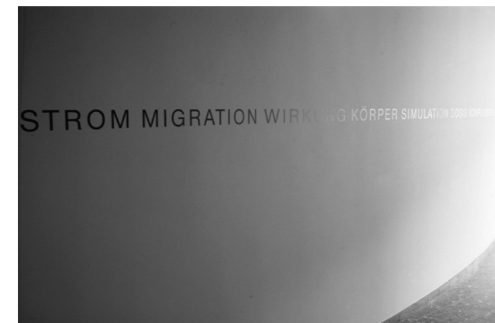
[4] INSTITUTSBILDER – EINE SCHRIFT BILD INSTALLATION [PICTURING INSTITUTES – AN INSTALLATION OF LETTERED IMAGES], 1991 Universität Zürich, Schriftbild, Farbauftrag mittels Schablonen University of Zurich, stencilled lettered image

Danuser's interest in our shared archetypal heritage has led him to collect a substantial number of children's rhymes from all over the world and in many languages. In his exhibition at Galerie Fasciati in Chur, Danuser has chosen to present words and counting out rhymes autonomously instead of juxtaposing them with his photographic work. The result is an installation precisely attuned to the space of the gallery and occupying all of the rooms. The surface banality of the counting out rhyme A ZELLA PÖLLA SCHELLA / KATZ GOT UF WALLISELLA / KHUNNT SI WIDER HEI / HÄT SI KRUMMI BEI / PIFF PAFF PUFF / UND DU BISCH EHR UND REDLICH DUSS*** is belied by a fascinatingly profound and complex phenomenon. In addition to folkloristic aspects, acoustic and phonetic elements come into play through the melodic rhythm and the flow of the language, whose impact is enhanced, in the local context, by the abrupt transition between the spoken dialect and written German. With inimitable childlike naïveté, the verses at times address historical issues and even recent political upheavals. Above all, the simple decision-taking aids in these rhymes are found