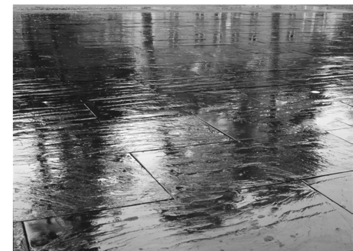
[5] SCHIEFERTAFEL BEVERIN [SLATE BEVERIN], 2001 Gestaltung des Zentrums-Platz der Psychiatrischen Klinik Beverin, Graubünden, ca. 1200 Schieferplatten je 100 x 200 cm, Gesamtfläche ca. 2400 m 2 Design of the main courtyard at the Beverin Psychiatric Clinic, Grisons, c. 1200 slabs of slate, 100 x 200 cm each, overall area c. 2400 m 2